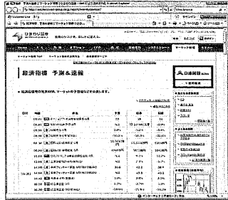
図表1 ひまわり証券「経済指標 予測&速報」