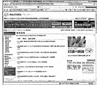
図表2 ロイター「経済指標」

まず為替相場に対する影響を見ているのであれば、FX業者が提供しているリアルタイムでの為替レートのチャートを見るという手がある。参考までにその一例を掲載しておこう(図表3・外為どっとコム「マーケット情報」)。